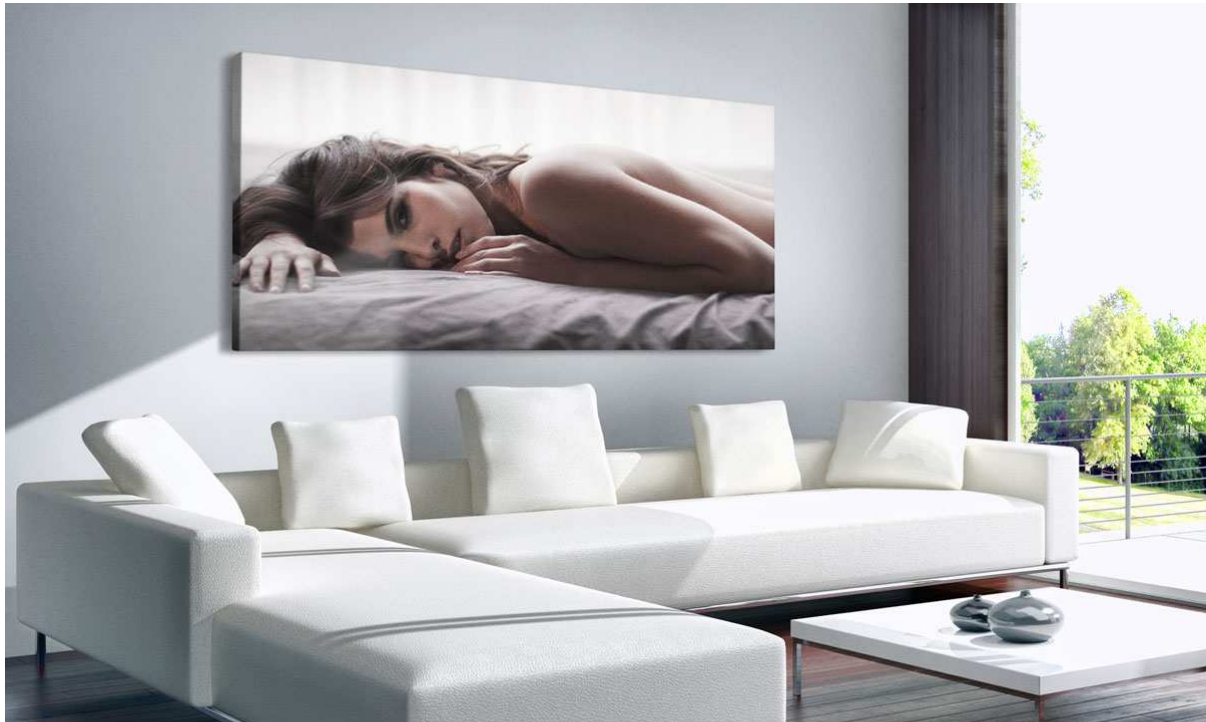
Abb.: Foto auf Acrylglas 240 x 80 cm auf 8 mm Premium Materialstärke realisiert

Nutzen Sie als registrierter Profifotograf folgenden Code, um einen Rabatt auf Ihre erste Bestellung zu erhalten: